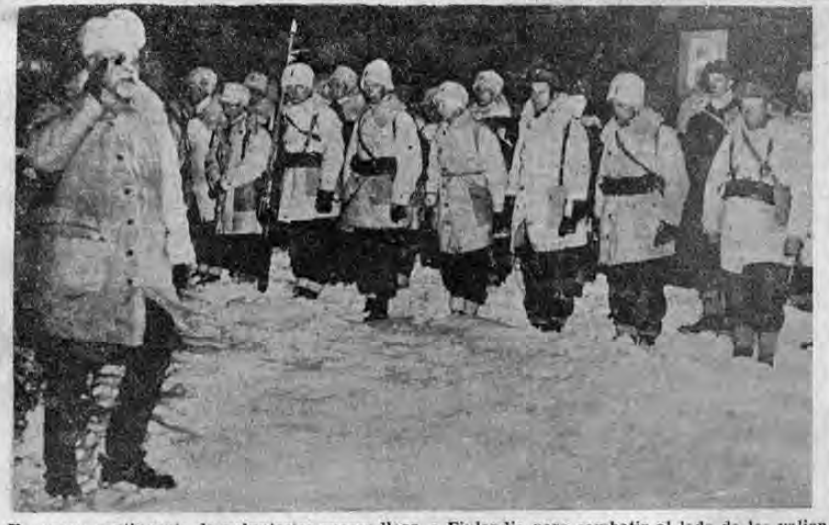
Un nuevo contingente de voluntarios suecos llega a Finlandia para combatir al lado de los valientes soldados que defienden sus hogares contra la invasión soviética. En la fotografía aparece uno de estos contingentes revistado por un general finés. Sobre la nieve los suecos formados reciben el saludo del veterano jefe finés.

Director: JOSE MARIA PINAUD * PAGINA UNO * AÑO XX * NUMERO 4783 SAN JOSE, COSTA RICA. A. C. VIERNES 9 DE FEBRERO DE 1940 EL UNICO DIARIO INDEPENDIENTE