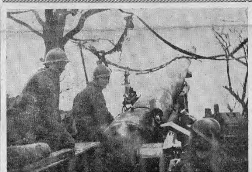
Uno de los más poderosos ejemplares de la artillería francesa es esta pieza de sitio de 320 milímetros emplazada en un lugar del frente y que está lista para empezar a lanzar sus tremendos proyectiles en cuanto reciba la orden del puesto de comando a que pertenece. La pieza está camuflada por medio de un sistema especial que la hace prácticamente invisible para los aviones a playtime.

En forma considerable ha seguido aumentando el movimiento de retiro de cédulas para las elecciones del domingo en la ciudad de San José. Según los datos que sobre el particular recogimos, el retiro de cédulas alcanza hasta ayer el 85 por ciento, advirtiéndose que en estos días han sido mayores las cantidades de cédulas que están retirando los ciudadanos. Los datos respectivos son los siguientes: del total de 16.483 cédulas de la ciudad de San José han sido retiradas hasta ayer 11.137 cédulas, o sea el 85 por ciento del total de las inscritas. Quedan por retirarse 5.346 cédulas. Calculase que en estos días, viernes, sábado y domingo, que es el día de la elección, se retiren como promedio diario noventa y siete cédulas. En consecuencia, retirándose en (FASA a la Pág. 4. Col. 1)